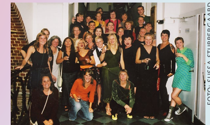
MEDARBETARE OCH STUDENTER VID KONFERENSFESTEN

Det internationella masterprogrammet i Gender Studies startar vid Samhällsvetenskapliga fakulteten.